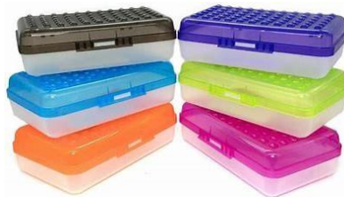
Ejemplo tamaño y modelo de cartuche