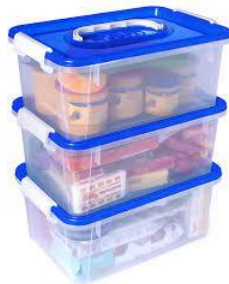
Ejemplo tamaño y modelo de caja plástica( es solo 1 caja)