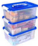
Modelo caja plástica